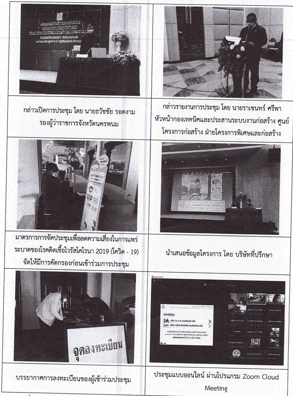
รูปที่ 7.1 ภาพบรรยากาศจากเวทีห้องประชุมฟอร์จูนแกรนด์บอลรูม โรงแรมฟอร์จูน ริเวอร์วิว อำเภอเมืองนครพนม จังหวัดนครพนม