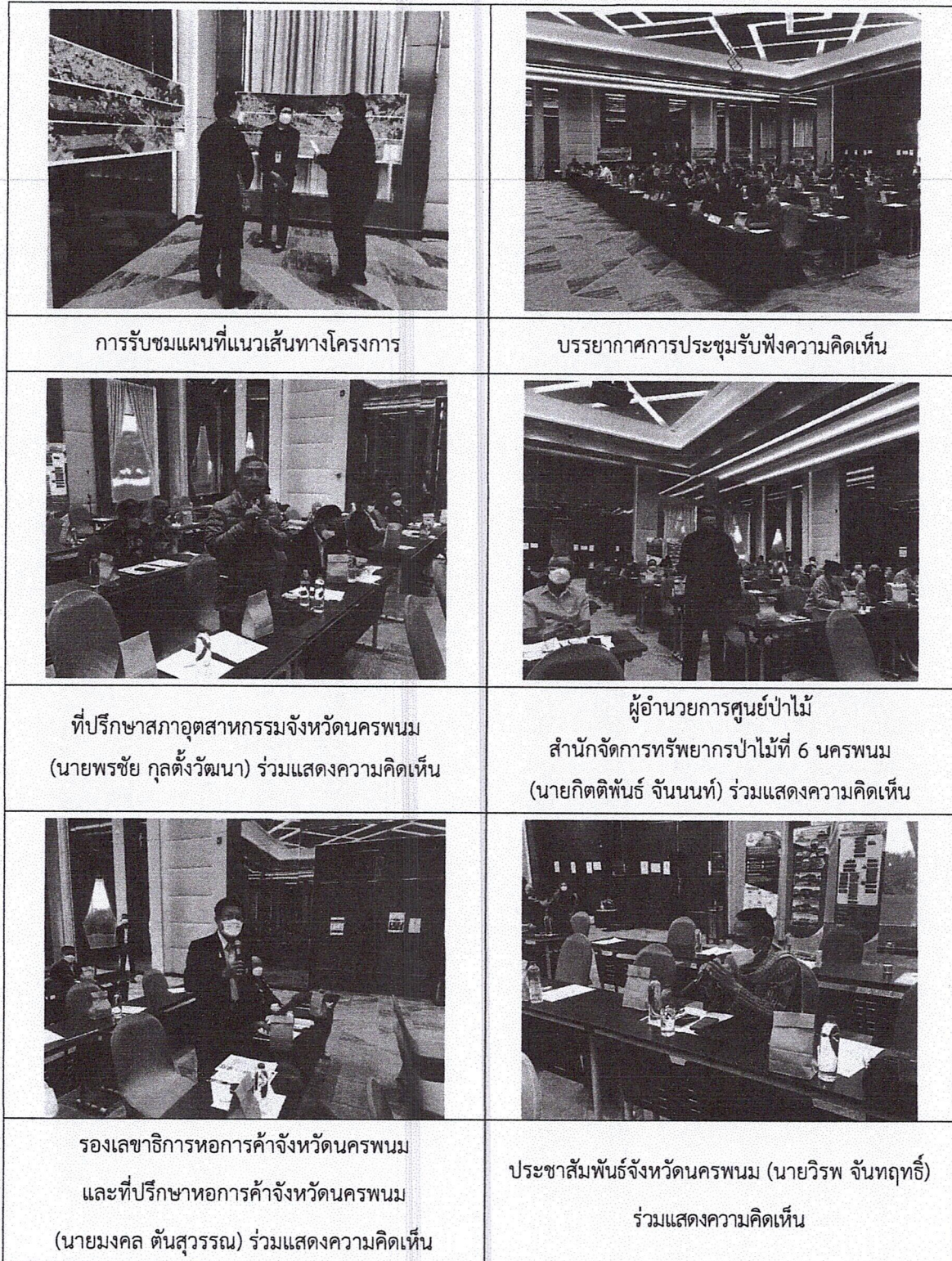
รูปที่ 7.1 ภาพบรรยากาศจากเวทีห้องประชุมฟอร์จูนแกรนด์บอลรูม โรงแรมฟอร์จูน ริเวอร์วิว อำเภอเมืองนครพนม จังหวัดนครพนม (ต่อ)